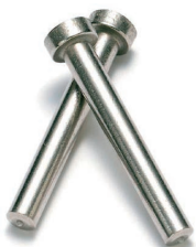
●不锈钢圆柱头焊钉