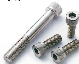
●不锈钢内六角圆柱头螺钉

尺 寸: M20, M24, M30 ~ M48 螺柱长度: 最大 1100mm (M20, 24 200 以上)