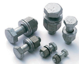
●镀锌高强度大六角头螺栓