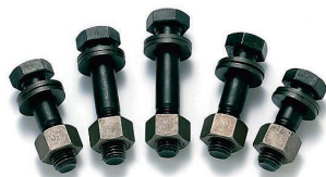
●高强度大六角头螺栓