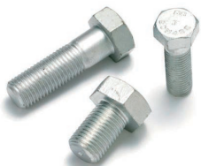
●8.8级镀锌高强度螺栓