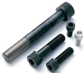
●内六角圆柱头螺钉

尺 寸: M20, M24, M30 ~ M48 螺柱长度: 最大 1100mm (M20, 24 200 以上)